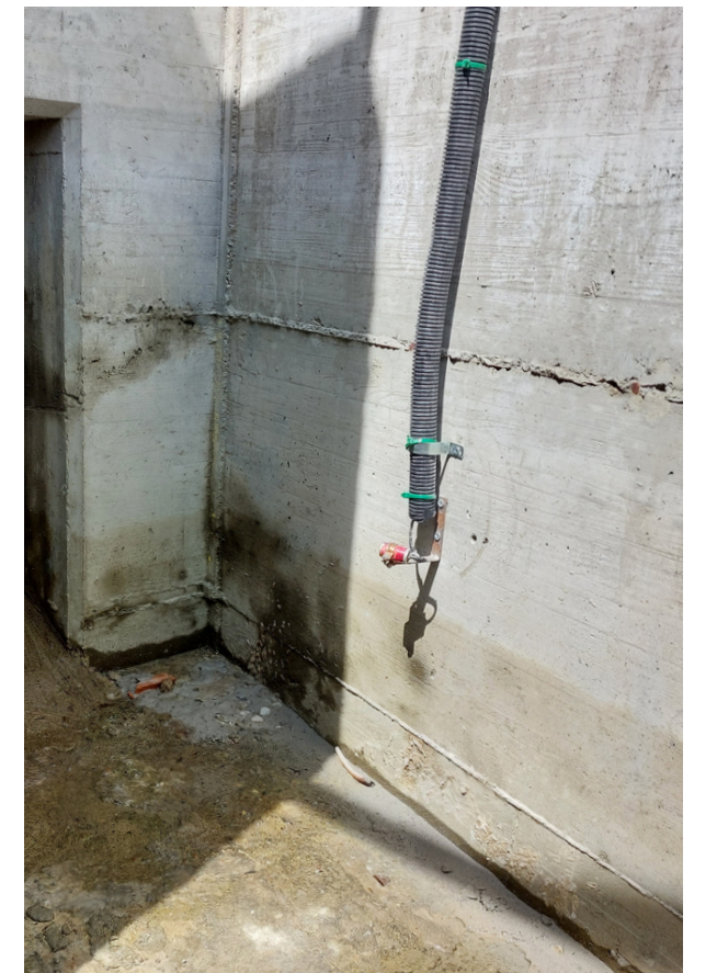
video monitoraggio in continuo nel passaggio per pesci di Roccapietra sul Fiume Sesia.