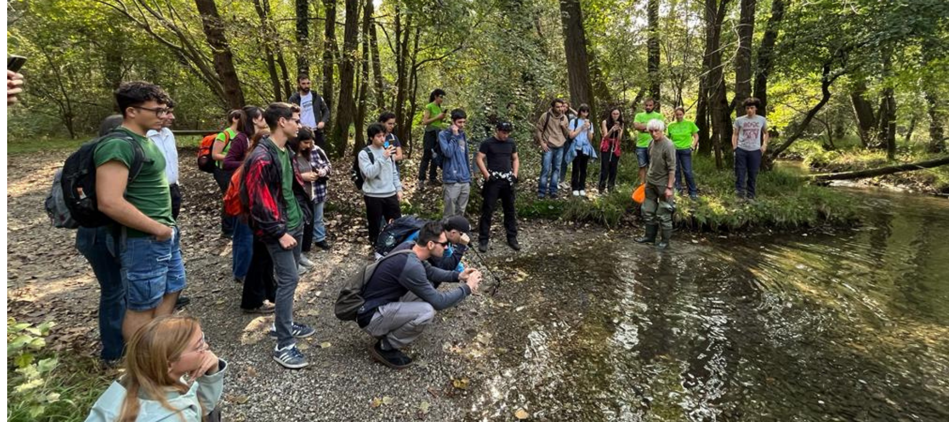
Attività di educazione ambientale: campionamento dei macroinvertebrati acquatici!