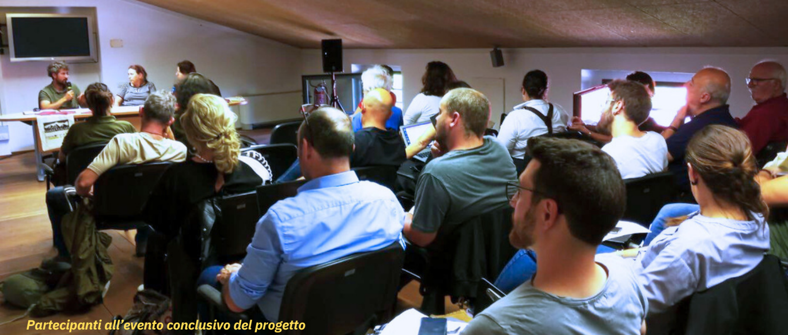
Partecipanti all'evento conclusivo del progetto