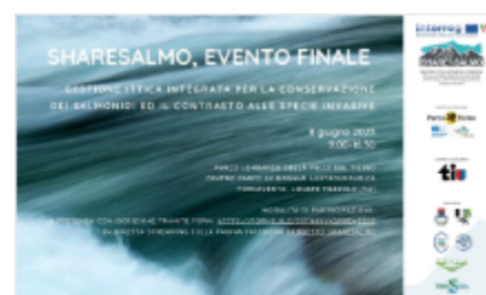
Evento finale del progetto SHARESALMO Sono ancora disponibili le dirette streaming sulla pagina FB di progetto dell'evento finale, realizzato giovedì 8 giugno 2023 presso Parco Lombardo della...

L'evento finale del progetto SHARESALMO è stato realizzato in presenza e in diretta facebook giovedì 8 giugno 2023 presso il Parco Lombardo della Valle del Ticino al Centro parco ex dogana austroungarica, Tornavento, Lonate Pozzolo (VA). L'evento ha presentato i principali risultati raggiunti e le prospettive future connesse al progetto SHARESALMO IV avviso. È stata un'occasione preziosa di scambio di buone pratiche con altri progetti cofinanziati anche da altri programmi europei dedicati alla Natura, tra cui il programma Life. In particolare la sessione pomeridiana dedicata al networking ha permesso di dare una panoramica ampia sull'innovazione, sulla ricerca e sulla pratica nella gestione della fauna ittica in tutta Italia.